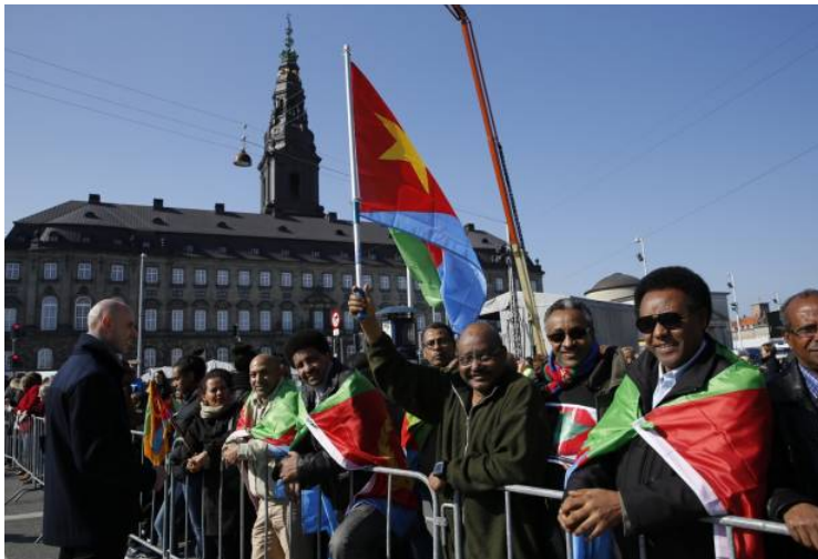
LAR.ERITREAS flag vajrer allerede på slotspladsen.

»Et: Jeg er selv løber. To: Jeg ved, at den her slags løb aldrig ville kunne lade sig gøre uden frivillige«.