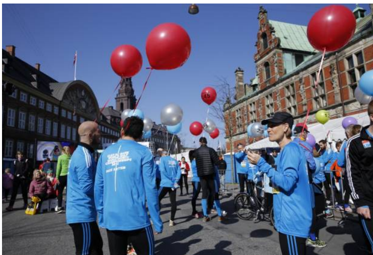
ALLONDANS. 110 fartholdere gør klar til at hjælpe motionsløberne gennem de 21,1 km.

»Det vil slet ikke kunne undgå at smitte af, når vi først har prøvet det en gang«.