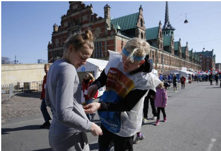
FORBEREDELSE. Løbere gør sig klar foran Børsen nær Christiansborg Slotsplads.

Spændte løbere samles med dere gule pose af plastik over skulderen. Klar til start.